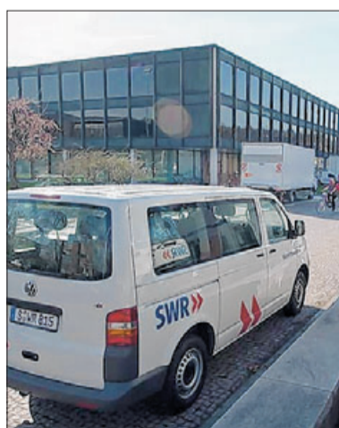
Vorbereitungen zur Berichterstattung über die Landtagswahl.

Schon seit Mitte Januar hat sich das Statistische Landesamt mit sei-nen Computern im Ebertsaal im Obergeschoss eingerichtet. Hier,